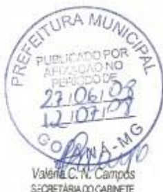
José Loures Ciconei PREFEITO DE GOIANÁ

Art. 30. A Lei Orçamentária de 2009 poderá autorizar a realização de operações de crédito por antecipação de receitas, assumidas a partir do dia 10 de janeiro, com quitação integral até o dia 10 de dezembro de 2009.